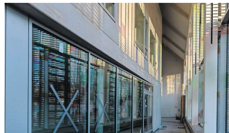
Das „Haus im Haus“: In die Außenwände der ehemaligen Orangerie wurde ein zweites Gebäude mit modernen Büros gesetzt.

Zentrum jüdischer Gelehrsamkeit von europäischem Rang entwickeln“, erläutert der Rabbiner. Die Bündelung der Einrichtungen wird die Ausstrahlung erhöhen. Davon ist auch Wissenschaftsministerin Manja Schüle (SPD) überzeugt: „Von diesem Ort wird eine bundesweite Strahlkraft ausgehen.“ Das Institut für Jüdische Theologie mit Fakultätscharakter ist eine „Besonderheit in Europa und einzigartig in Deutschland“, betont Schüle. Die drei Einrichtungen, die dort künftig