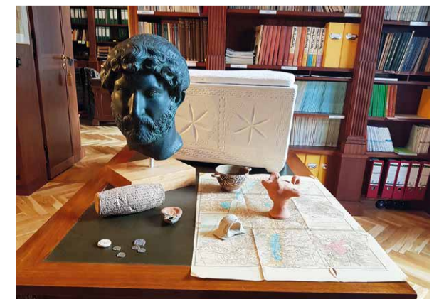
Anschauungsobjekte im Seminar