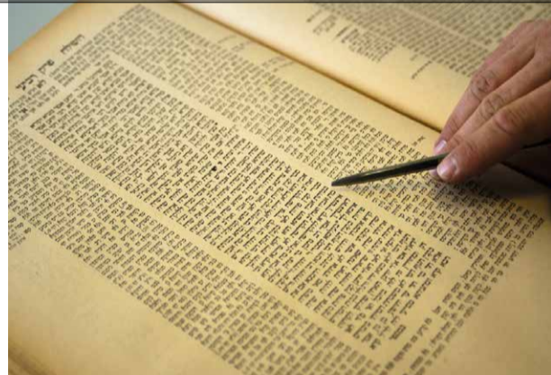
Talmud Bavli, Traktat Gittin