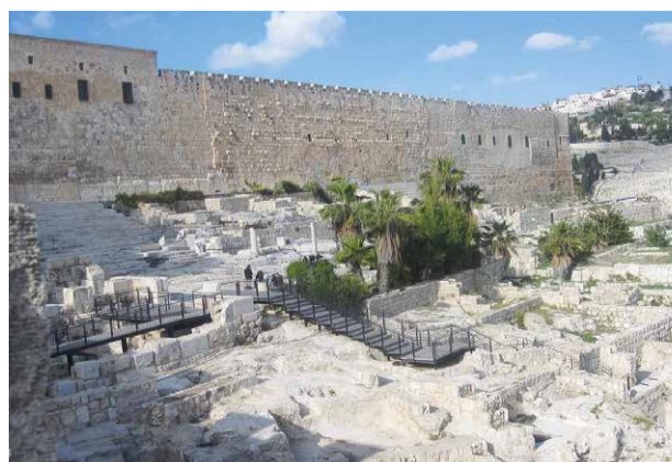
Jerusalem, Ofel excavations

Mit der Eröffnung der School of Jewish Theology an der Universität Potsdam hat sich nach fast zweihundert Jahren die Forderung nach der Gleichberechtigung der jüdischen Theologie mit den christlichen Theologien und dem Islam erfüllt. Der in Europa einmalige Studiengang steht Interessierten unabhängig von ihrer Religionszugehörigkeit offen und spannt einen Bogen von der Hebräischen Bibel über die theologischen Werke des Mittelalters zu den Denkern und Diskursen der Moderne.